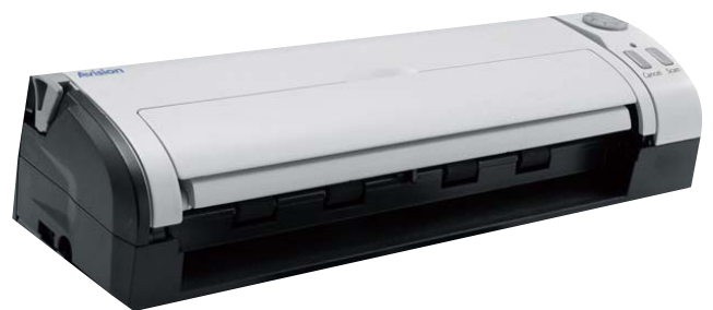
AV50F módulo destacável