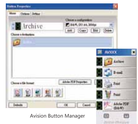
Avision Button Manager

O scanner Avision AV50F vem com os drivers TWAIN e ISIS e também é fornecido com o scanner a versão completa do software exclusivo Avision Button Manager, ScanSoft, PaperPort, Avision ScanProfolio, WorldCard.