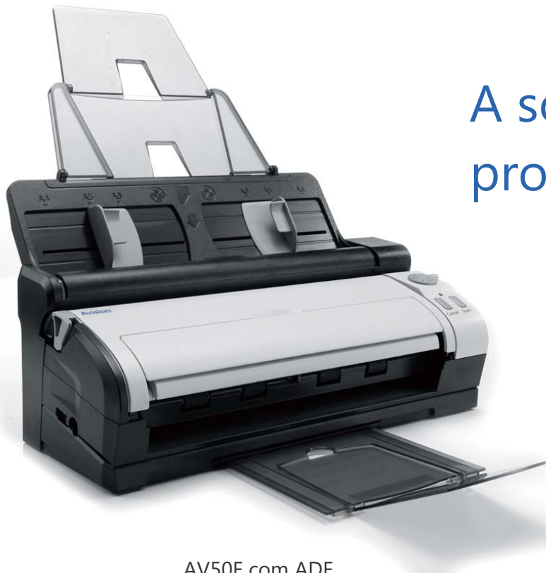
AV50F com ADF